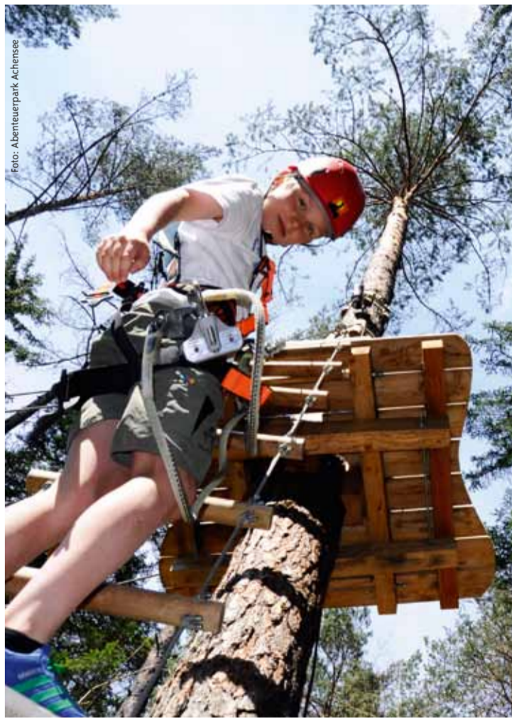
Kostenlose iAchensee Applikation • www.facebook.com/achenseetourism www.twitter.com/tvbachensee • www.flickr.com/achenseetourism www.youtube.com/TVBAchensee